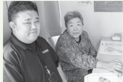
デイサービス趣味活動より