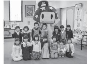
健康福祉大会より

九戸村においても益々少子高齢化が進み、高齢化率38.05%の状況のもと、本年度も昨年度にひきつづき、地域包括支援センター・村・民児協・各関係機関・地域との連携、協力を得ながら、地域と一体となった見守り活動を推進し、高齢者・障がい者が地域で安心して暮らせる地域づくりを目指してまいります。