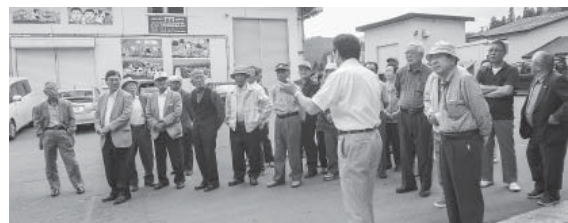
九戸村老人クラブ 連合会視察研修