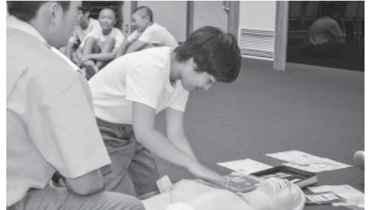
災害ボランティア講習会より