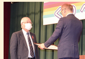
九戸村文化協会 様