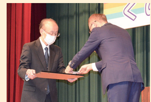
九戸村舞踊研究会 様