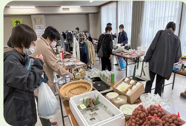
産業・芸術文化まつり [令和7年10月25日]

伊保内婦人会、九戸村赤十字奉仕団、九戸村社会福祉協議会職員親睦会の方々よりご協力いただきました。