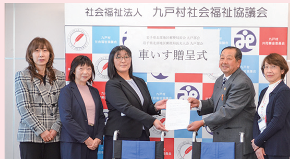
岩手県北部地区郵便局長夫人会 九戸部会

岩手県北部地区郵便局長会九戸部会・夫人会九戸部会では地域貢献活動として毎年地域の福祉団体等への寄付活動を行っています。又、村内の郵便局長と村との定例情報交換会を毎月開催し、地域に根差した活動を行っています。