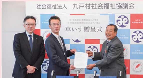
岩手県北部地区郵便局長会 九戸部会