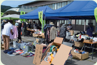
畜産まつり [令和7年9月6日]